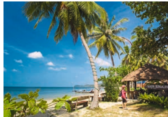
An den Stränden von Koh Jum gibt es keine großen Hotelbauten und kein Remmidemmi

☺☺☺ Steile Treppen führen zu den Bungalows des »Koh Jum Ocean Beach Resorts« ( www.kohjumoceanbeachresort.com , +66-75-656027, Bungalow ab € 63 ÜF). Hinter der Lobby im oberen Bereich liegt der Pool, am Strand das Restaurant. Online Bungalow ab € 56 ÜF, Agoda .