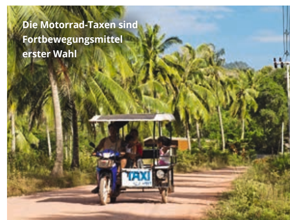
Die Motorrad-Taxis sind Fortbewegungsmittel erster Wahl

riesigen Banyan-Baum, dessen Wurzeln sich über den gesamten Hang ziehen ( www.banyanbayvillas.net , +66-86-1025248, Bungalow ab € 92 ÜF). Online Bungalow ab € 78 ÜF, Agoda .