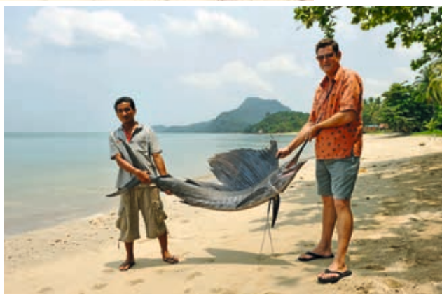
Beeindruckender Fang: Der Fächerfisch mit seiner großen segelförmigen Rückenflosse ist ein schmackhafter Raubfisch

An der Zufahrtsstraße zum »Joy Bungalow« liegt das kleine Restaurant »Drift Wood«. Angeboten werden einige europäische Gerichte wie Spaghetti (ab € 5) und Thai-Spezialitäten. Probieren Sie unbedingt den scharfen Pomelo-Salat mit Garnelen (€ 3,30)!