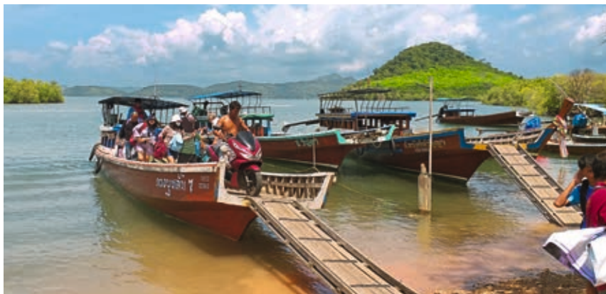
Auf die Insel Koh Jum gelangen Urlauber wie Einheimische mit einfachen Longtailbooten